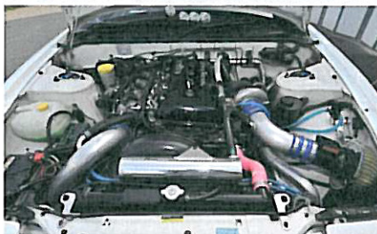
GPスポーツ胸形サンとヤシオファクトリー岡村サンという走りに並々ならぬこだわりを持つチューナーが自ら開発したからこそ、本当にほしいと思える特性に仕上がった