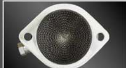
高効率150セルメタル触媒

[エグザス パワーキャタライザー] SUS304オールステンレス 保安基準適合/自動車排出ガス試験結果成績表付 ¥69,000~(本体価格) (税込¥72,450~)